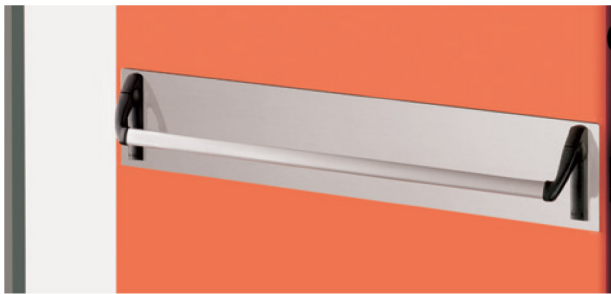
Avec perçages prédéposés pour le passage du carré poignée et du cylindre