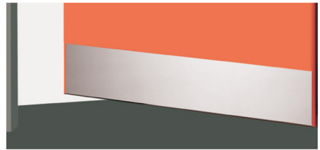
Exemples d'application côté poussant